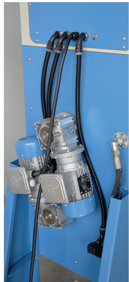
Achterzijde met de aandrijfmotoren