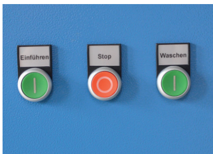
Bedieningstoetsen overzichtelijk geïntegreerd in de machine