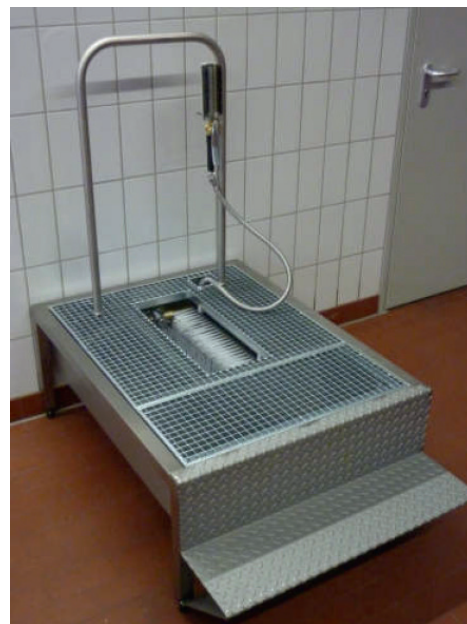
Afbeelding: STW 337-B met steunbeugel

De laarzenwasmachine uit de 337-serie bestaat uit een speciaal vervaardigde roestvrij stalen kuip met een gegalvaniseerd rooster in de zool en zijborstels. De kuip is bedekt met twee gegalvaniseerde roosters met een centrale uitsparing. Aan de voorkant van de uitsparing zit een automatische waterstopkraan die met de punt van de voet wordt bediend. Zijdellingse spoelpijpen leiden het water over de borstels op het schoeisel. Een waterdoorvoerende handborstel maakt extra reiniging van de schacht van de laars of andere te reinigen onderdelen mogelijk. Een in de kuip geïntegreerde afvoer met slibvangput en stankafsluiter zorgt voor een optimale afvoer van vuil water en een gescheiden opvang van grof vuil. Voor eenvoudige reiniging kan het rooster aan de voorkant uit het apparaat worden verwijderd.