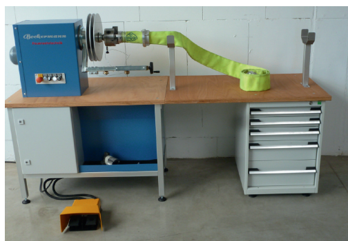
SEM-E 455 WB Compleet model met werkbankverlenging en ladeblok

De draad wordt gelijkmatig en strak om de slang gewikkeld vanaf roterende schijven waarop de binddraad via een spanarm met span- en geleidingsinrichting wordt gespoeld. De vaste drieklaw voorkomt dat de slangen draaien. Voor het aanbinden van de zuigslangen wordt een slanghouder onder het tafelblad vandaan getrokken. De elektrische bediening bevindt zich in een schakelkast onder het tafelblad. De rotatie van zowel de klemarm als de draaitafels met de bindinrichting gebeurt via een dubbele voet voor een traploze snelheidsregeling. Een noodstop en een slipkoppeling voldoen aan de eisen van het arbeidsbeschermingsreglement.